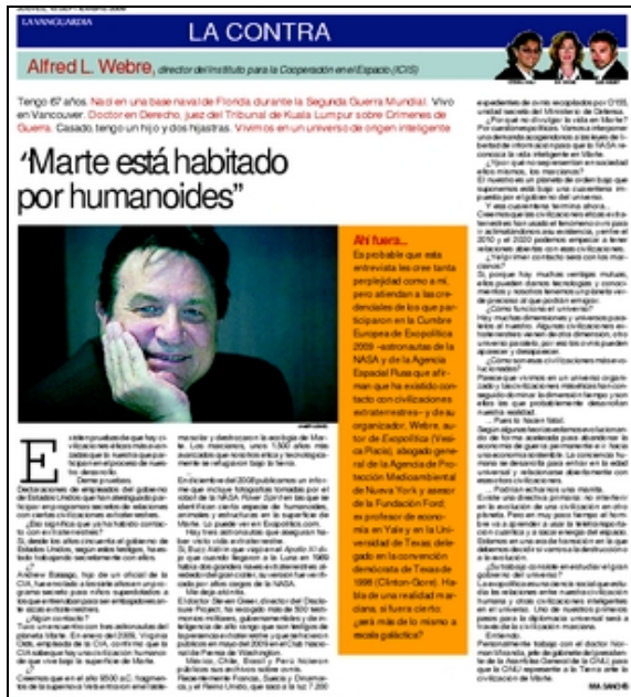
Alfred L. Webre de MARS en La Vanguardia de España en septiembre de 2009