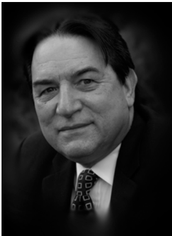
Alfred Lambremont Webre

Pero en muy poco tiempo el hombre va a aprender a usar la teletransportación cuántica y a sacar energía del espacio. Estamos en una era de transición en la que debemos decidir si vamos a la destrucción o a la evolución.